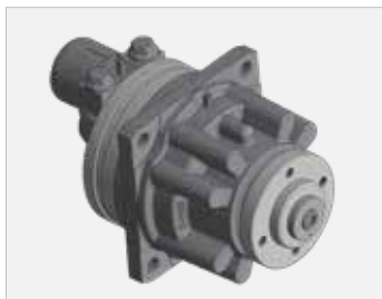
Pro-Drive-Antrieb Pro-Drive unit